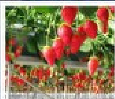
สวนผลไม้ฮามาบิตสึ