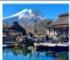
โอชิโนะ ฮัทโท