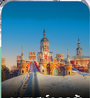
คฤหาสน์วอลก้า