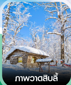
ภาพวาดสีบลู