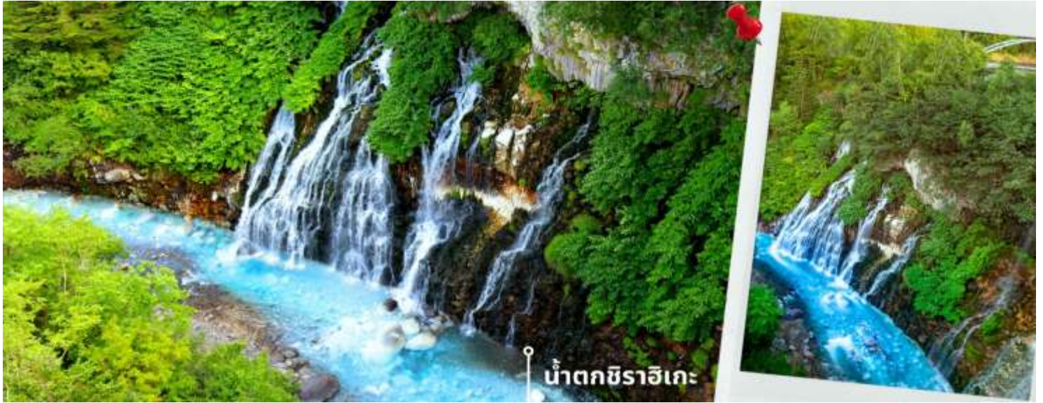
น้ำตกชิราอิเกะ

ก่อนเดินทางสู่เมืองอาซาฮิกาว่า หลังจากนั้นพาท่านเดินทางไปยัง อโณมอลล์ AEON MALL ภายในตัวห้างมีร้านค้าต่างมากมาย ซึ่งตกแต่งในรูปแบบที่ทันสมัยสไตล์ญี่ปุ่นสินค้ามากมายหลากหลายให้เลือกตั้งแต่เสื้อผ้าแฟชั่น อาหารสดใหม่และอุปกรณ์ภายในบ้านรวมไปถึงเครื่องสำอาง ขนมญี่ปุ่นต่างๆและยังมีร้านค้ามากมายไม่ว่าจะเป็น Muji, 100 yen shop, Sanrio store, Capcom games arcade และก็ยังมิซูเปออร์มาร์เก็ตขนาดใหญ่ให้ท่านได้เลือกซื้อของช้อปปิ้งตามอัธยาศัย