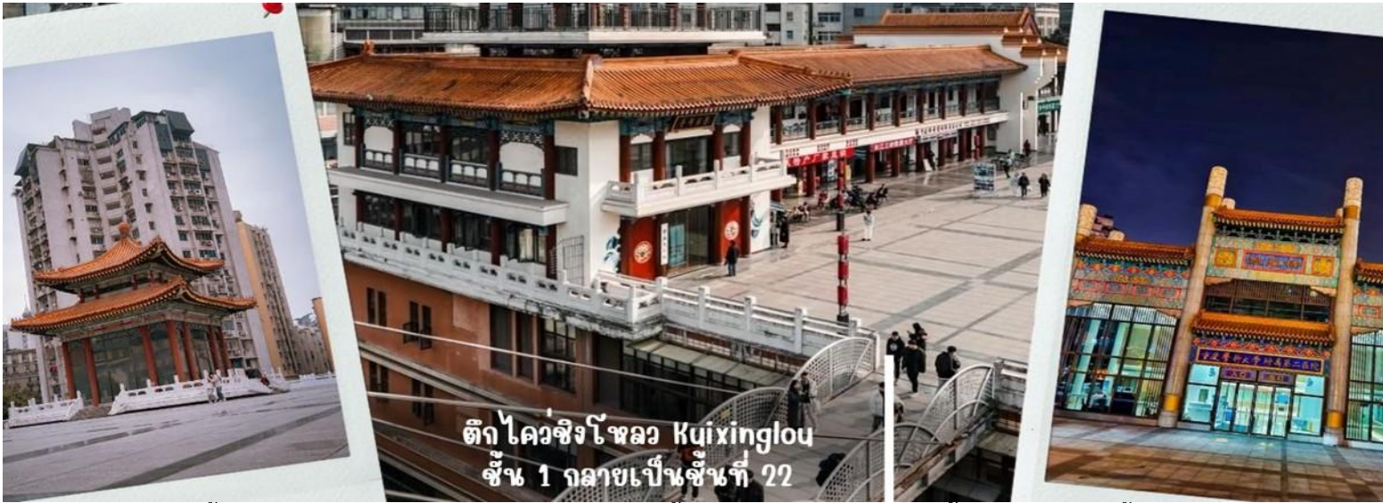
ตึก ไควชิงโหลว Kuixinglou ชั้น 1 กลายเป็นชั้นที่ 22

นำท่านเดินทางไปชมความแปลกใหม่ที่ ตึกไควชิงโหลว (ตึก 22 ชั้น) Kuixinglou ชั้น 1 กลายเป็นชั้นที่ 22 ของอีกฝั่ง อาคารเก่าแก่ดั้งเดิมหัตถ์จรรยา ยังเป็นสถานที่ถ่ายทำภาพยนตร์เรื่อง "Young You" โดย Yi Yang Qianxi "Kui Xing Tower" อาคารโบราณที่ตั้งอยู่ในเมือง ที่นี่ได้รับการต่อเติมและสร้างขึ้นใหม่ในปี 1991 สิ่งมหัศจรรย์ที่สุดที่นี่ไม่ใช่ตัวอาคาร แต่เป็นสะพานแขวนสองแห่งระหว่างจัตุรัสกับอาคารสำนักงาน สะพานแขวนที่เต็มไปด้วยรถกลมเชื่อมระหว่างชั้น 1 ของจัตุรัสกับชั้นบนสุดของชั้น 22 ฝั่งตรงข้ามมองลงมาจากชั้น 1 จะเห็นได้ว่าด้านล่างมี 22 ชั้น เป็นอาคารที่มีลักษณะพิเศษที่เมืองฉงชิ่ง ประเทศจีน เนื่องจากภูมิประเทศที่เป็นภูเขา อาคารแห่งนี้จึงมีทางเข้าในระดับที่ต่างกัน เป็นจุดถ่ายรูปและชมวิวที่โดดเด่นของเมืองฉงชิ่งที่ได้ชื่อว่าเป็น "เมืองสามมิติ"