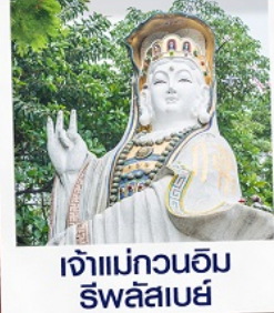
เจ้าแม่กวนอิม ริ้วลีสเบย์