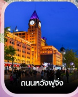
ถนนหลวงฟู้จิ่ง

คอนเฟิร์ม ออกเดินทาง ทุกพีเรียด 2 ท่านขึ้นไป