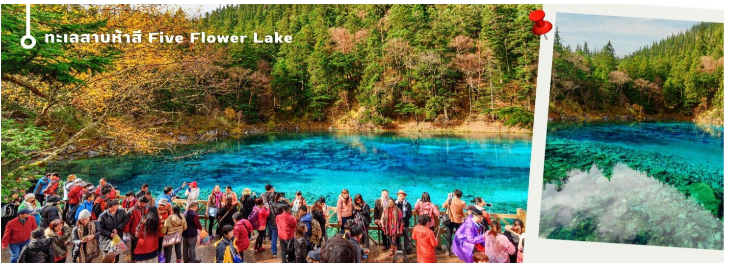
ทะเลสาบห้าสี Five Flower Lake

ทะเลสาบที่ใหญ่ที่สุด สูงที่สุด และลึกที่สุดในจิวจ้ายโกว ด้วยเนื้อที่กว่า 581 ไร่ ความยาวกว่า 7 กิโลเมตร และลึกถึง 103 เมตร ทอดตัวโค้งเป็นรูปพระจันทร์เสี้ยว เนื่องจากหิมะบนภูเขาละลายลงมา น้ำในทะเลสาบสีฟ้าสวยงาม ล้อมรอบด้วยยอดเขาสูงชัน และต้นไม้ใหญ่ที่ปกคลุมด้วยหิมะ งดงามราวหลุดออกมาจากภาพวาด ความพิเศษในช่วงฤดูหนาว ทะเลสาบจะกลายเป็นน้ำแข็งหนากว่า 60 ซม. ทำให้นักท่องเที่ยวนิยมมาเล่นสเก็ตน้ำแข็งกันเป็นจำนวนมาก