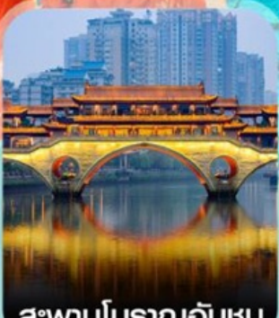
สะพานโบราณอันชุน