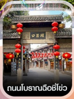
ถนนโบราณฉือชี่โฮ่ว