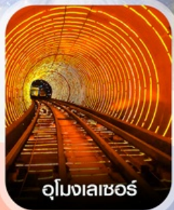
อุโมงเลเซอร์

✈️ คอนเฟิร์มออกเดินทาง ✈️ ทุกพีเรียด 2 ท่านขึ้นไป