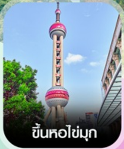
ขึ้นหอไข่มุก