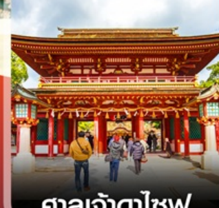
ศาลเจ้าตาไซฟุ