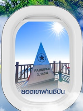
ยอดเขาฟานซิปิน

✈️ คอนเฟิร์มออกเดินทาง ✈️ ทุกพีเรียด 2 ท่านขึ้นไป