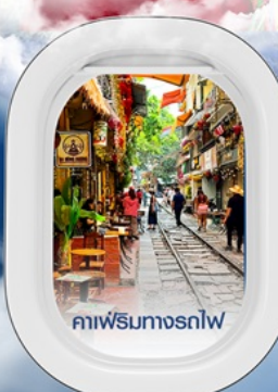
คาเฟ่ริมทางรถไฟ