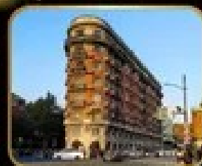
ตึกหรู ดินแดน WUKANG MANSION