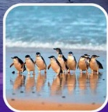
เพนกวินที่เกาะฟิลลิป