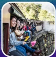
รถไฟจักรไอน้ำที่โบราน