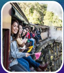
รถไฟจักรไอน้ำที่โบราน