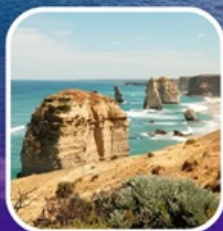
Great Ocean Road (ครึ่งสาย)