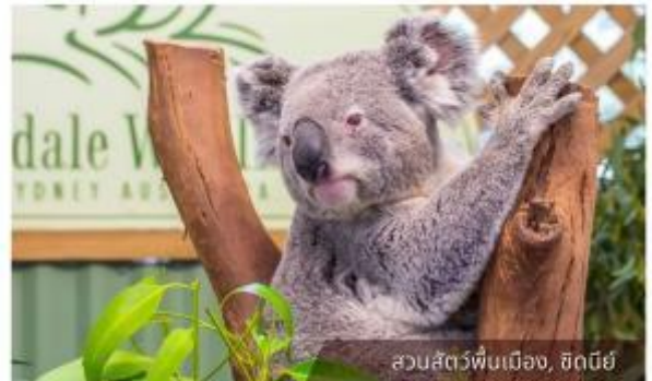
สวนสัตว์ฟีนเมือง, ซิดนีย์