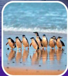
เพนกวินที่เกาะฟิลลิป