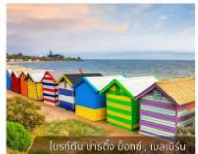
โบสถ์สีรุ้ง, เมลเบิร์น