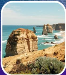
Great Ocean Road (ครึ่งสาย)