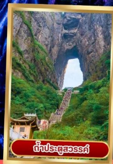
ถ้ำประตูสวรรค์