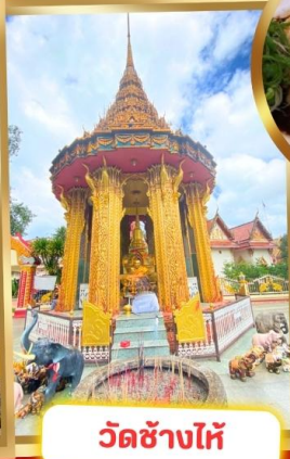
วัดช้างไห้