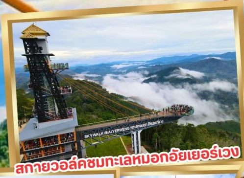
สกายวอล์คชมทะเลหมอกอัยเยอร์เวง