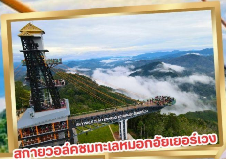
สกายวอล์คชมทะเลหมอกอัยเยอร์เวง

ร่วมโครงการ ลดหย่อนภาษี ลดสูงสุด 15,000.-