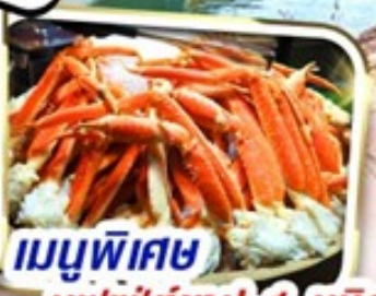
เมนูพิเศษ บุฟเฟ่ต์ชาปู 1 ชนิด