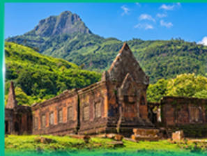
ปราสาทหินวัดพู