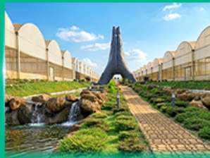
Agro Vege Farm