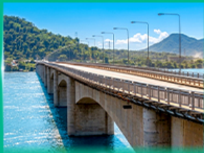
สะพานมิตรภาพลาว - ญี่ปุ่น