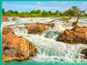
น้ำตกหลี่ผี