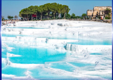
ปราสาทบุนยาดียา บามุกคาเล