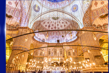
เข้าชมความงามสุเหร่าสีน้ำนีน