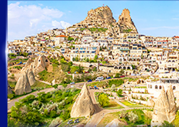
หุบเขาอูซึซาร์ คัปปาโดเกีย