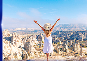
ชมความงดงาม หุบเขาแห่งรัก