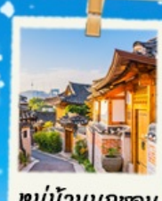
หมู่บ้านนูกซอน