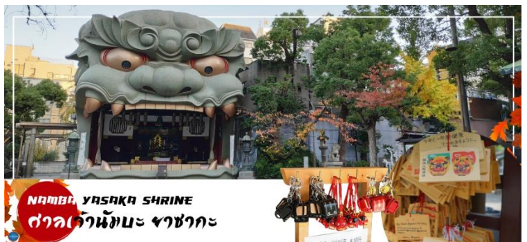
NAMBA YASAKA SHRINE ศาลเจ้านัมมะ ยาซากะ

นำทุกท่านเช็คอินจุดถ่ายรูปที่ ศาลเจ้านัมมะยาซากะ (Namba Yasaka Shrine) ในย่านนัมมะของเมืองโอซาก้า ไฮไลท์ของศาลเจ้าแห่งนี้ คือรูปปั้นหน้าสิงโตอ้าปากขนาดใหญ่ ที่เชื่อกันว่าสามารถกลืนกินปีศาจร้าย หรือ สิ่งไม่ดีทั้งหลาย ให้หายไป และนำพามาซึ่งความโชคดีให้แก่ผู้คน ปัจจุบันนักเรียน นักศึกษา และผู้ประกอบการธุรกิจนั้น นิยมมาขอพรให้ประสบความสำเร็จกันที่นี่ ด้วยความสูง 17 เมตร ความกว้าง 11 เมตรและความลึก 7 เมตร อีสระให้ทุกท่านสักการะ และเก็บภาพที่ ศาลเจ้านัมมะ ยะชะกะ