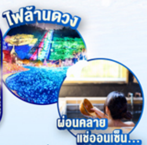
ไฟล้านดวง