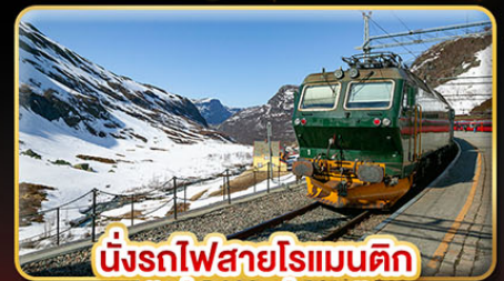
นั่งรถไฟสายโรแมนติก “พร้อมสปาหน้า”