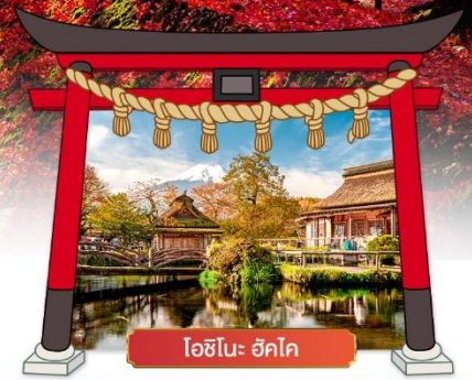
โอชิโนะ ฮักโค

เดินทางโดยสายการบิน : ไทยแอร์เอเชียเอ็กซ์