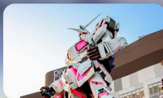
ช็อบบิงโอไดบะ