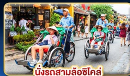
นั่งรถสามล้อฮิโคล่