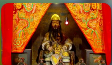
องค์แขกเก่า 600 ปี