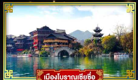
เมืองโบราณเซี่ยซือ