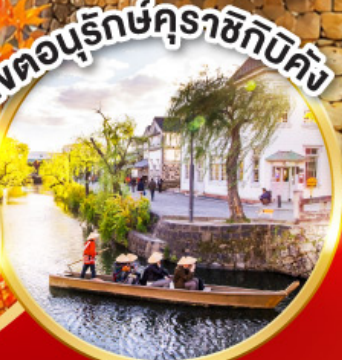
เขตอนุรักษ์คุราชิกิบิคัง