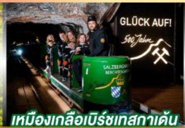
เหมืองเกลือเบิร์ชเทสกาเดิน