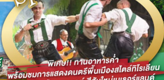
พิเศษ!! ทานอาหารค่ำ พร้อมชมการแสดงดนตรีพื้นเมืองสไตล์โรเลียน และเยือนเมืองอูเทรคต์ สีสันใหม่เนเธอร์แลนด์

ไฮไลท์โปรแกรม • เยือนเมืองแห่งแคว้นบาวาเรีย และ ทิโรล • สุกสนานเหมืองเกลือเบิร์ชเทสกาเดิน • เข้าชมปราสาทนอยชวานสไตน์ • เดินเล่นจัตุรัสโรเมอร์ ซอปปิง Zeil Street • ถ่ายรูปมุมสวยของหมู่บ้านอัลสติก • ซิล่า ไปในเมืองซาลสบูร์ก บ้านเกิดโมสาร์ท • ล่องเรือหมู่บ้านทีธูร์น และ ล่องเรือชมนครอัมสเตอร์ดัม • ซอปปิงจุใจย่านดัมสแควร์และเดินเล่นย่านโคมแดง 25 ก.ย. - 04 ต.ค. 69 09-18, 16-25 ต.ค. 69 22-31 ต.ค. 69 / 06-15 พ.ย. 69 29 ธ.ค. 69 - 07 ม.ค. 70 * ปีใหม่ *