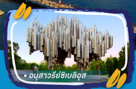
• อนุสาวรีย์ซิบิลิอุส