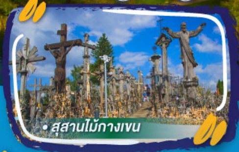
• สุสานไม้กางเขน