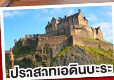
ปราสาทเอдинบะระ