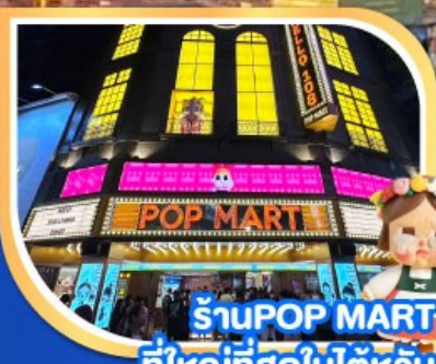
ร้านPOP MART ที่ใหญ่ที่สุดในไต้หวัน