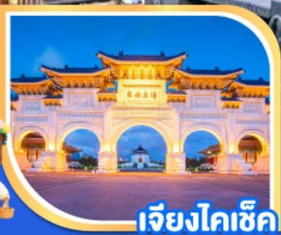
เจียงไคเช็ค