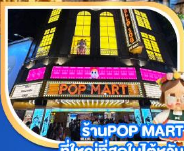
ร้าน POP MART ที่ใหญ่ที่สุดในโลก