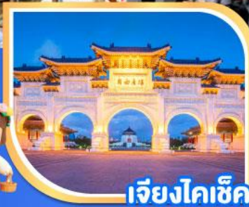
เจียงไคเช็ค