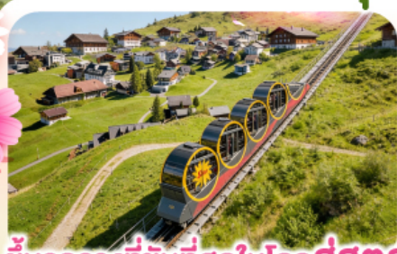
ชั้นรางที่ชันที่สุดในโลกสู่สตูล

พิชิตยอดเขาชุนเนกกา 1 ในเขาที่สวยงามที่สุดเมืองเซอร์แมท