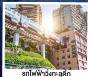
รถไฟฟ้าวิงทะเล-ลู่ตีก