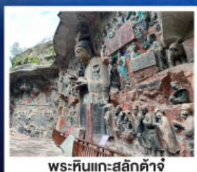
พระหินแกะสลักคำจู้