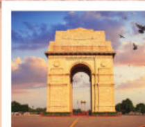
♡♡▽ India Gate