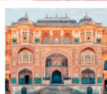
♡♡▽ Amber Fort