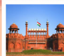
♡♡▽ Agra Fort