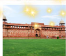
Ajmer Sharif Dargah