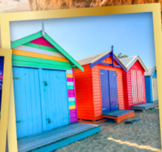
ไบรด์ตัน บาร์ตัง บ็อกซ์

03-10, 12-19 เม.ย.68 24 เม.ย.-01 พ.ค.68 08-15, 22-29 พ.ค.68 29 พ.ค.-05 มิ.ย.68