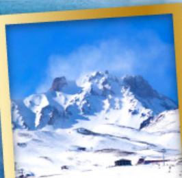
ภูเขาไฟเออซีเยส์