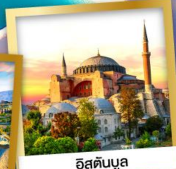
อิสตันบูล