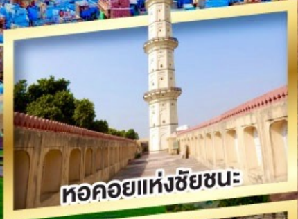
หอคอยแห่งชัยชนะ