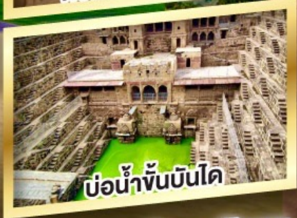
บ่อน้ำขั้นบันได