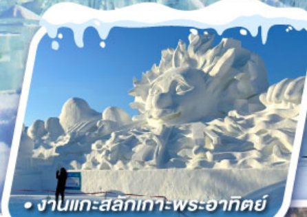
• งานแกะสลักเทว-พระอาทิตย์

ชมดอกเกล็ดหิมะ อู๋ซิง ทัศนียภาพอัศจรรย์แห่งทะเลสาบกระฉอก จิ่งป้อหู