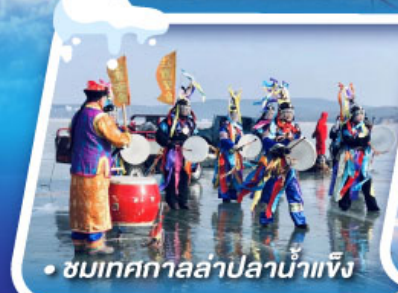
• ชมเทศกาลล่าปลาน้ำแข็ง

งานเทศกาลแกะสลักหิมะที่ใหญ่ที่สุดในโลก HARBIN ICE & SNOW FESTIVAL 2025 เที่ยวหมู่บ้านหิมะ ดินแดนหิมะอันสุดประทับใจ