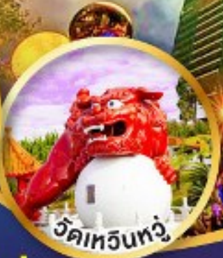
วัดเหวินทง