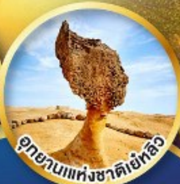
อุทยานแห่งชาติเย้หลิว