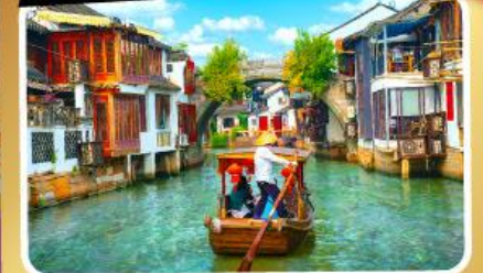
เมืองโบราณจู่เจียเจียว