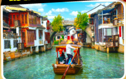
เมืองโบราณซูโจวเจียเจียว