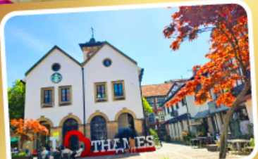
เทมส์ทาวน์