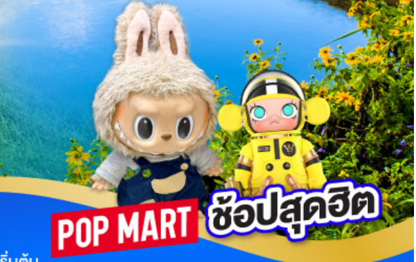
POP MART ซ้อปสุดฮิต