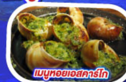
เมนูหอยแอสคาร์โท