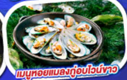
เมนูหอยแมลงภู่อูบไวน์ขาว