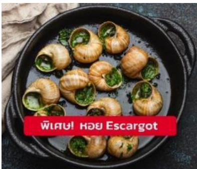
พิเศษ! หอย Escargot

เย็น ๑๐ รับประทานอาหารเย็น (มื้อที่2) เมนูพิเศษ!! หอย Escargot