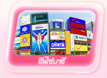
ชินเซ็นยาชิ