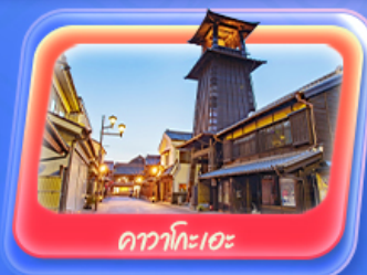
คาวาโกะเอะ