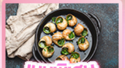
เมนูพิเศษ หอยเอสคาโท

เยอรมัน เนเธอร์แลนด์ เบลเยียม ฝรั่งเศส Keukenhof