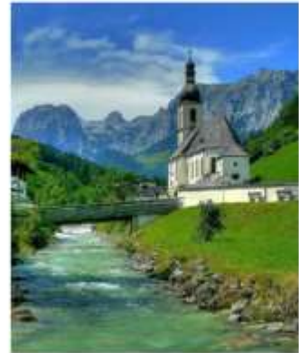
ออสเตรียบาวาเรียดินแดนแห่งเทพนิยาย

ออสเตรีย – บาวาเรีย (Austria-Bavaria) ดินแดนวัฒนธรรมเก่าแก่ที่ครอบคลุมสองประเทศและแทบแยกกันไม่ออกเลยที่เราเที่ยวอยู่ในออสเตรียหรือเยอรมัน ท่านจะประทับใจไปกับหมู่บ้านเล็กๆน่ารัก ที่ตั้งอยู่บริเวณริมทะเลสาบในเทือกเขา “เยอรมัน-ออสเตรียแอลป์” พร้อมบริการอาหารรสเลิศและที่พักอย่างดีระดับ 4 ดาว หรรษาที่เราคัดสรรมาให้ท่านได้พักผ่อนอย่างเต็มที่ให้การเดินทางของทุกท่านคุ้มค่าที่สุดในเส้นทางที่สวยงามที่สุดของออสเตรีย-บาวาเรีย