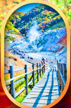
หุบเขานรกจิกโคคาบิ